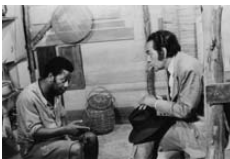
A negação do Brasil

de Michael Hoare 2003, 52', legendado A associação DAL (Droit au Logement – Direito à Moradia) ganhou reconhecimento dos franceses por criar um novo modo de luta política, voltada para os meios de comunicação e para a opinião pública por meio de ações midiáticas. O filme conta como é a luta pelo direito à moradia na França, onde cada vez mais pessoas, principalmente imigrantes pobres vindos da África, disputam locais sem condições apropriadas para abrigar uma família.