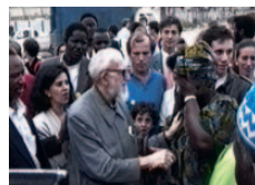
Imagens do DAL