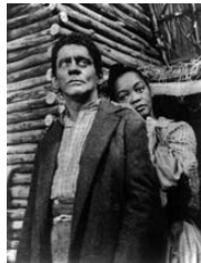
A negação do Brasil

de Michael Hoare 2003, 52', legendado A associação DAL (Droit au Logement – Direito à Moradia) ganhou reconhecimento dos franceses por criar um novo modo de luta política, voltada para os meios de comunicação e para a opinião pública por meio de ações midiáticas. O filme conta como é a luta pelo direito à moradia na França, onde cada vez mais pessoas, principalmente imigrantes pobres vindos da África, disputam locais sem condições apropriadas para abrigar uma família.