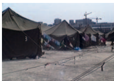
Imagens do DAL