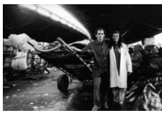
O sonho de São Paulo