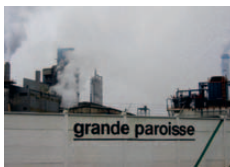
Que merda de fábrica