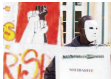
Entre nós - sem papéis, sem rosto, sem palavras

de Carole Sionet 2003, 52', legendado Paralelamente à Paris turística, um grupo de pessoas vive sem direito a trabalho ou a ajuda oficial, com medo da expulsão do território francês a qualquer momento. Neste filme, os "sem-papéis", clandestinos vindos de países pobres, contam suas histórias e mostram uma França bem diferente dos cartões postais.