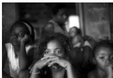
Salve! Santo Antônio

Para mais de 90 mil habitantes de Santo Antônio de Jesus, a 180 km de Salvador (BA), a fabricação clandestina de fogos de artifício representa a única fonte de renda. No dia 11 de dezembro de 1998, uma dessas usinas explodiu deixando 64 mortos, a maioria formada por mulheres e crianças. Seis anos depois, as feridas físicas e morais ainda não foram cicatrizadas, como mostra Aline Sasahara.